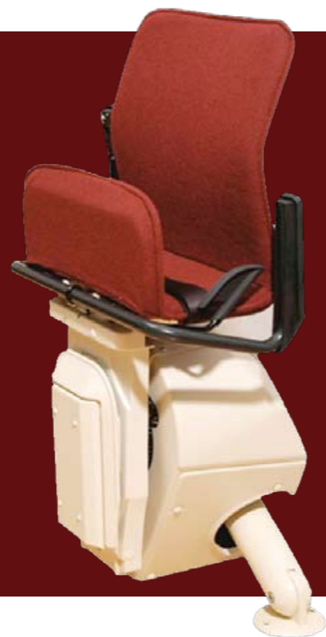
CHART offre eleganza e comodità, è disponibile in diversi colori e i pulsanti di comando sono situati nella parte finale del bracciolo dove le mani possono appoggiarsi in modo naturale durante il tragitto.

CHART è un montascale a poltroncina che adotta un sistema di salita a guida singola in acciaio verniciato adattabile a qualsiasi tipo di scala curva e rettilinea.