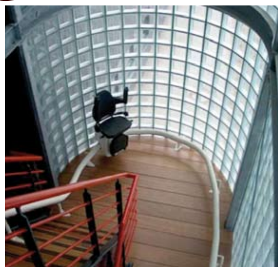
CHART è un montascale a poltroncina essenziale, moderno e innovativo che coniuga la funzionalità e il comfort con l'economicità senza trascurare la sicurezza d'esercizio.

Con CHART è possibile l'installazione delle poltroncine montascale anche con cambi di pendenze e scale particolarmente inusuali.