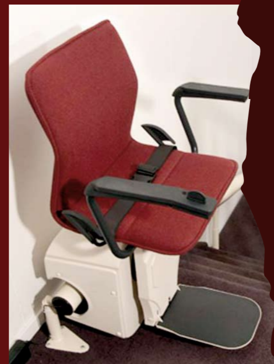
CHART è un montascale a poltroncina che adotta un sistema di salita a guida singola in acciaio verniciato adattabile a qualsiasi tipo di scala curva e rettilinea.

CHART offre eleganza e comodità, è disponibile in diversi colori e i pulsanti di comando sono situati nella parte finale del bracciolo dove le mani possono appoggiarsi in modo naturale durante il tragitto.